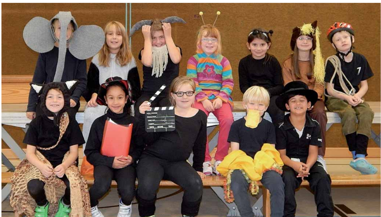
„Wenn die Ziege schwimmen lernt“ – ein Theaterstück über Stärken und Schwächen

Die Aufführung des Theaterstückes „Wenn die Ziege schwimmen lernt“ auf der Grundlage des gleichnamigen Bilderbuchs