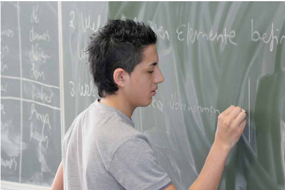
Sprachliche Fähigkeiten erkennen und fördern

Schüler mit Migrationshintergrund – obwohl die Nachfrage nach Hauptschulen stark rückläufig ist – mehr als doppelt so häufig als diejenigen ohne Migrationshintergrund die Hauptschule. Bei der Empfehlung zu höheren Bildungsgängen wie Gymnasien verhält es sich umgekehrt. Auch das „Sitzenbleiben“ kommt bei Kindern und Jugendlichen mit Migrationshintergrund je nach Bundesland zwischen zwei bis viermal so häufig vor wie bei denjenigen ohne.